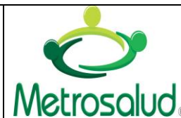
Tabla de contenido